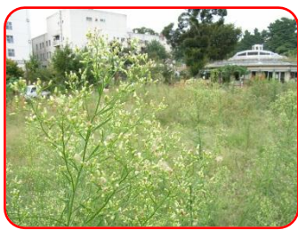
キク科の花咲くころ《中目黒公園》