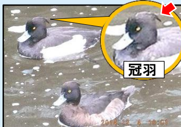
(上)キンクロハジロ(オス) (下)キンクロハジロ(メス)

東京湾など海辺にいる冬鳥。海岸付近や河口、海に近い池沼などに群れで生活しています。