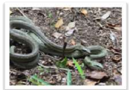
2匹のアオダイショウ

大都会がすぐ近くにある駒場野公園は、さまざまな生きものが暮らす自然豊かな公園です。夏の人気者カブトムシやクワガタはもちろん、カマキリ、ナナフシ、カミキリムシといった昆虫が見られ、アオダイショウやアマガエルも公園の仲間です。里地・里山に近いこの公園は、都内では少なくなった生きものたち大切なすみ家。珍しいからといってむやみに持って帰ると、公園から姿を消してしまうかもしれませんよ。(駒場野公園自然観察舎より)