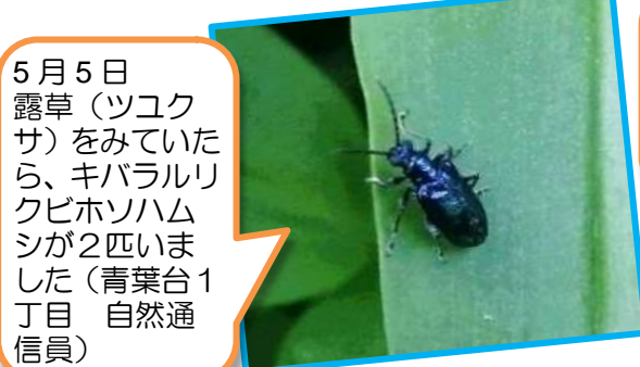
5月5日 露草(ツクク サ)をみていた ら、キバラルリ クビホソハム シが2匹いま した (青葉台1 丁目 自然通 信員)