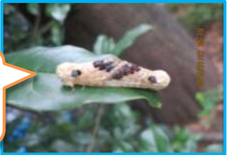
9月18日 2匹のモンクロ シャチホコ (柿の木坂3丁 目 自然通信員)