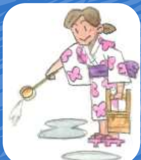
目黒の歳事 打ち水