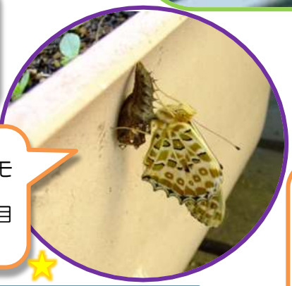
9月18日 ツマグロヒョウモ ンの羽化を観察 (柿の木坂3丁目 自然通信員)