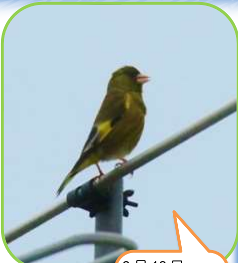
9月18日 カウラヒワが TVアンテナの 上で鳴いていた (緑が丘2丁目 自然通信員)