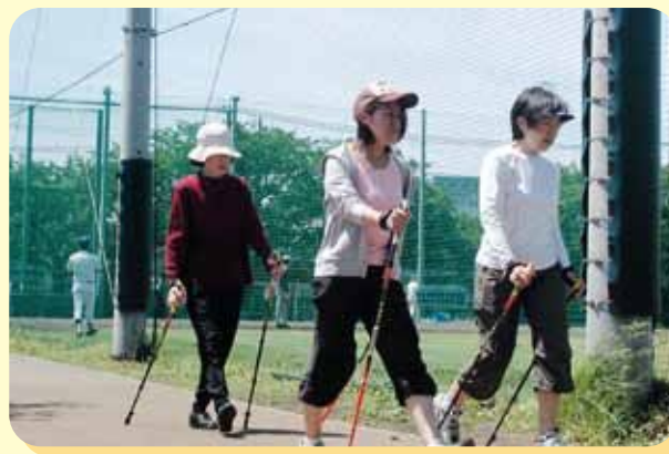
▲ノルディックウォーキング