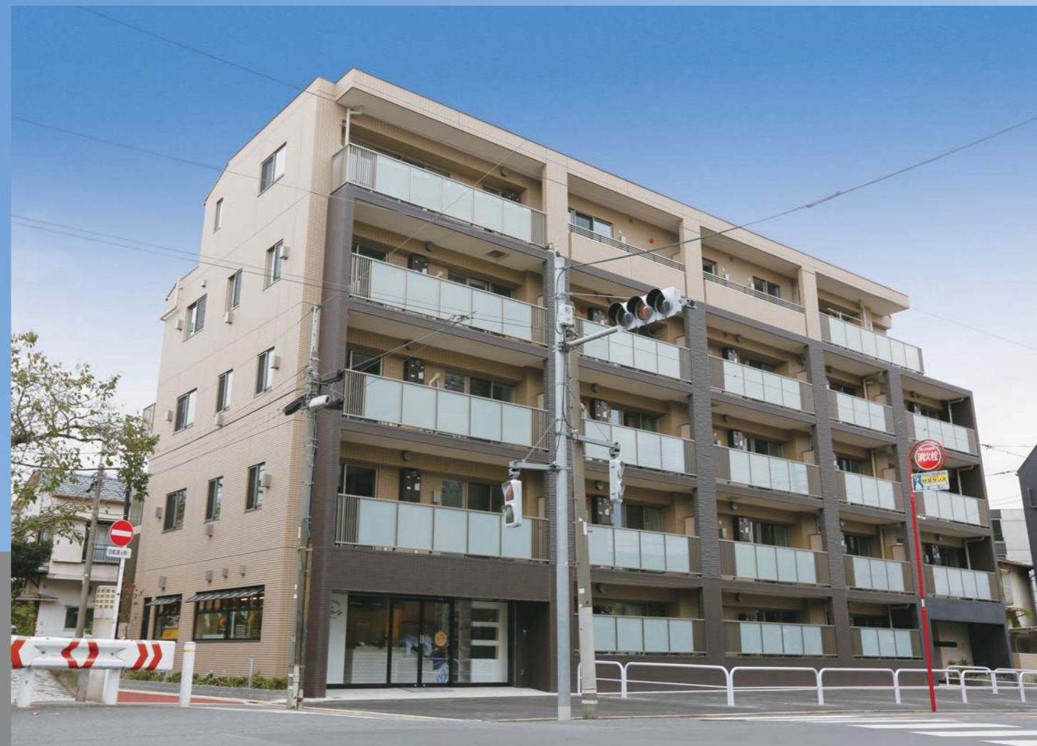
竣工写真 / 平成28年10月撮影