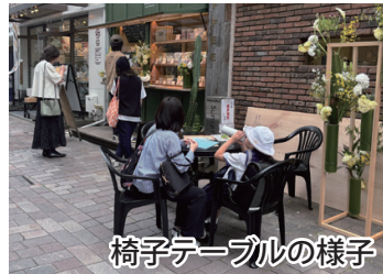
椅子テーブルの様子