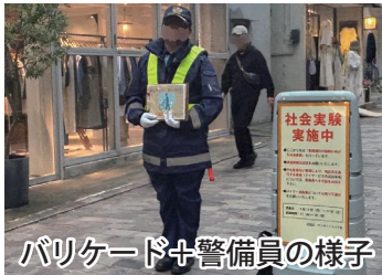
バリケード+警備員の様子