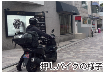
押しバイクの様子