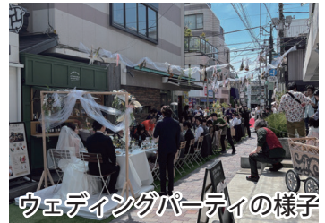
ウェディングパーティの様子