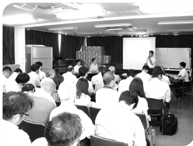
<街づくり検討会説明会及び設立総会の様子>

今後、会長・副会長及び事務局で検討会の進め方、及びその他の役員等について検討し、改めて会員の皆様にお諮りさせていただきます。