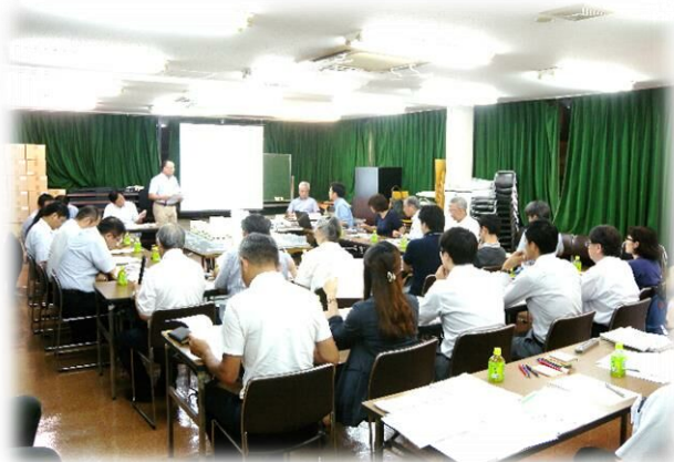
＜第12回街づくり検討会の様子＞

これまで権利者から寄せられたご意見を街並み再生方針(案)へ反映しました。今後、(株)ジェイ・スピリットから検討会で提示した案を東京都へ提案する予定です。