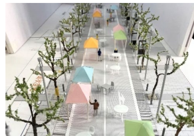
<イベント時のイメージ>