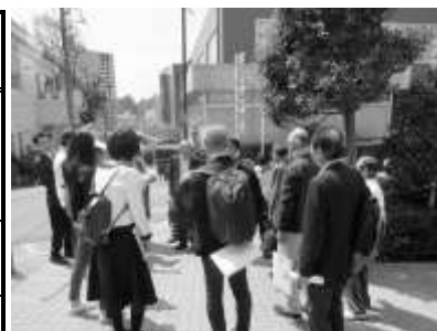
第2回協議会で実施した街歩き H31年4月