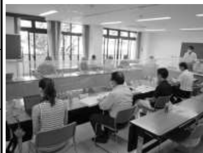
第11回協議会の様子 令和3年7月