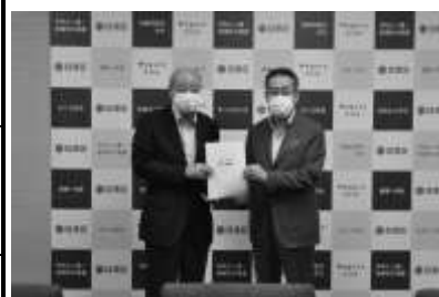
街づくり提案書を区に提出した時の様子 令和3年9月