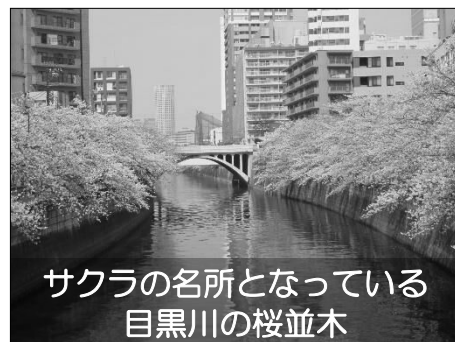
サクラの名所となっている 目黒川の桜並木