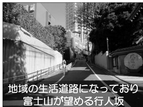
地域の生活道路になっており 富士山が望める行人坂