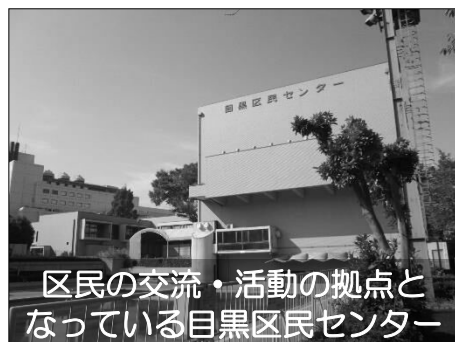
区民の交流・活動の拠点と なっている目黒区民センター