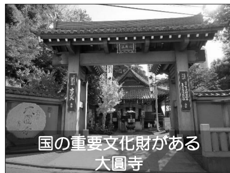
国の重要文化財がある 大圓寺