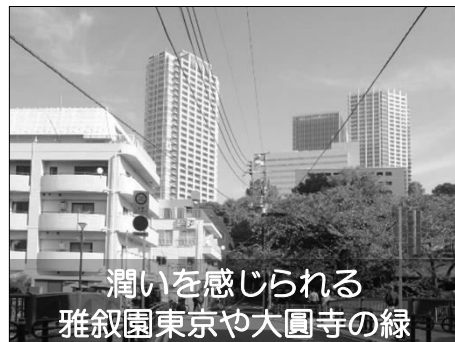
潤いを感じられる 雅叙園東京や大圓寺の緑