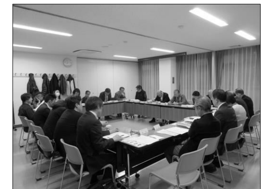
写真：第1回 下目黒一丁目地区街づくり協議会の様子