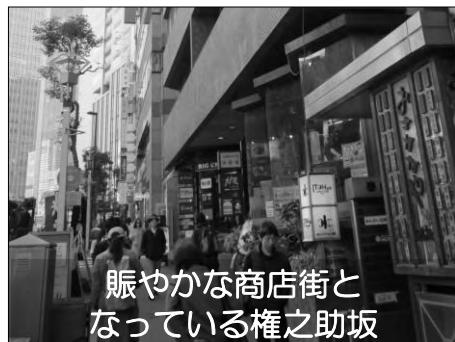
賑やかな商店街と なっている権之助坂