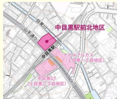
中目黒駅前北地区 (上目黒一丁目20番、21番)

今後は、説明会等でいただいたご意見を参考にし、令和8年6月頃を目安に、都市計画(案)を取りまとめる予定です。