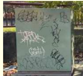
落書きされた地上機器 (トランスボックス)