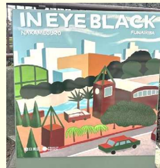
トランスラッピング (令和6年度実施)