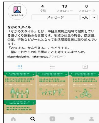
SNSでの普及イメージ 「なかめスタイル」のInstagram

町会・商店会・企業などが行っている清掃活動や地域のイベントのほか、「なかめスタイル」に結びつく活動などについて、InstagramなどのSNSに投稿していきます。その他、いろいろな取組を進めていきたいと考えていますので、ぜひ、皆さんも「なかめスタイル」について考え、活動にご参加ください。