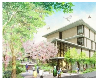
西郷山通りから見た新キャンパス →

中目黒と代官山を結ぶ目切坂沿いで建設が進んでいる「東京音楽大学」の新キャンパスが、平成31年4月に開校します。多くの方が行きかい音楽芸術を感受する場となり、また、学生の皆さんが多様な人々や文化と出会い「まちと協奏する」ことが期待されます。