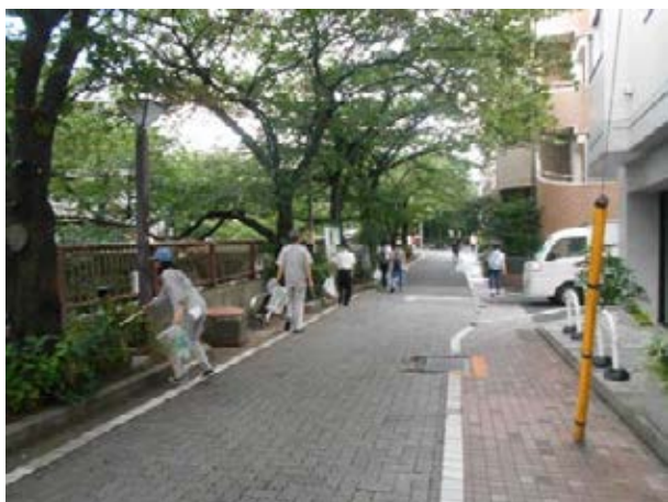
地域連携による清掃活動