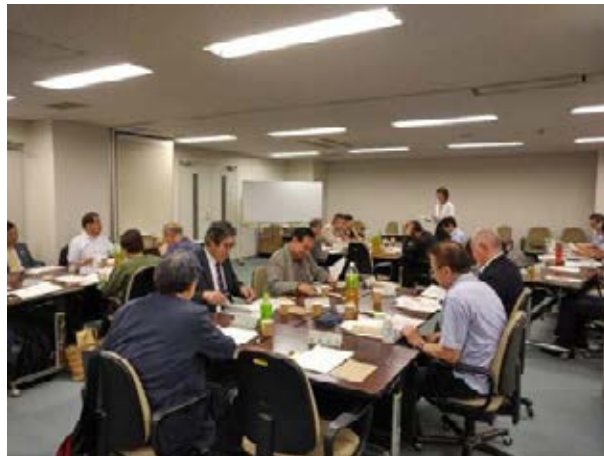
中目黒駅周辺地区街づくり協議会