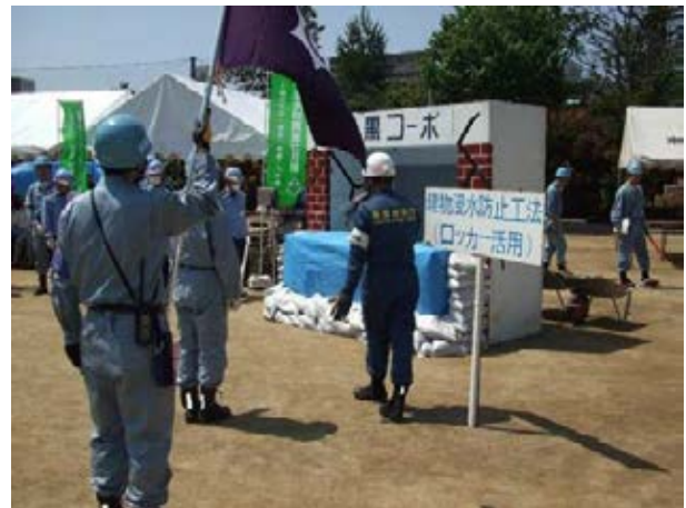
目黒区総合水防訓練