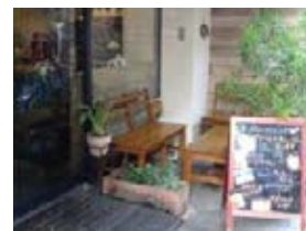
<駅南側エリア>敷地内の店舗前空間を活用した休憩スペースなど