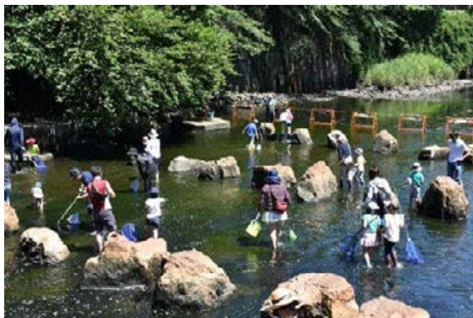
目黒川で行った「いきもの発見隊」