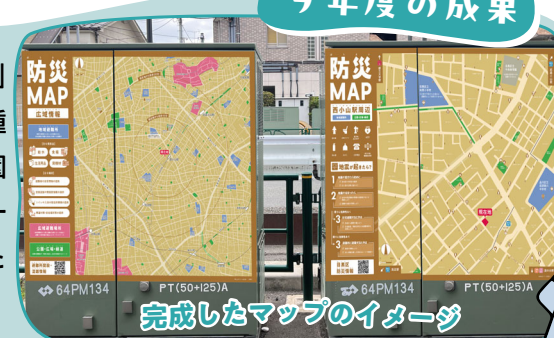
完成したマップのイメージ

「西小山駅周辺の避難情報マップ」と「広域避難情報マップ」の2種の防災マップが完成し、新設公園に設置された地上機器とパークホームズ西小山の敷地内に設置された地上機器にラッピングされます。