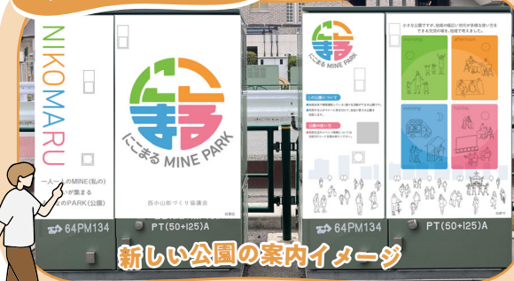
新しい公園の案内イメージ

新設公園内に設置された地上機器に、公園が地域の交流の場となることのメッセージとともに、魅力発信もできるラッピングを制作しました。