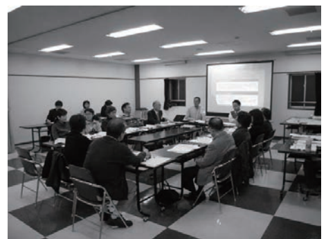
第23回協議会の様子

○第21回（平成23年10月6日（木））、第22回（平成23年10月28日（金））、第23回（平成23年11月18日（金））、第24回（平成23年12月1日（木））では、『西小山街づくり構想（案）』の作成に向けて、「街の将来像」、「街づくりの方針」、「街づくり構想図」等の検討を行いました。この度、構想案のたたき台として「西小山街づくり構想案（たたき台）」を取りまとめましたので、その概要をご紹介します（3.4.5ページを参照）。