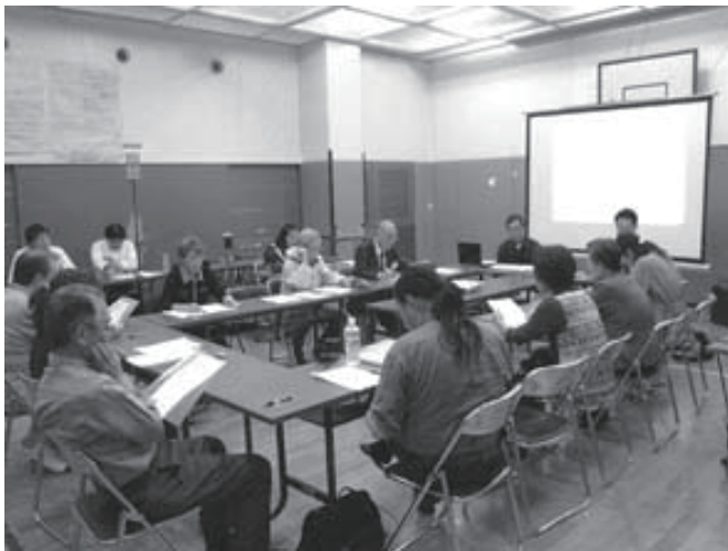
■第21回協議会の様子