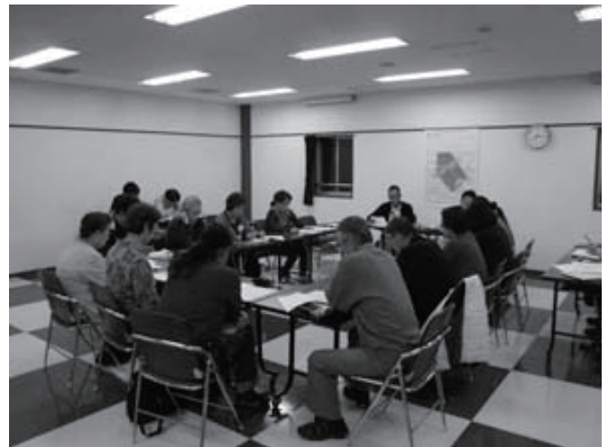
■第22回協議会の様子