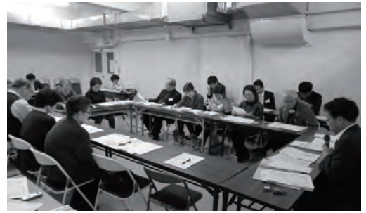
第29回協議会の様子

第29回（平成24年4月24日（火））西小山街づくり協議会では、西小山街づくり構想（案）を目黒区へ提案したことの報告、西小山の街づくりの平成24年度の目標の確認、西小山街づくり協議会や街区別検討会の進め方について、議論・検討を行いました。