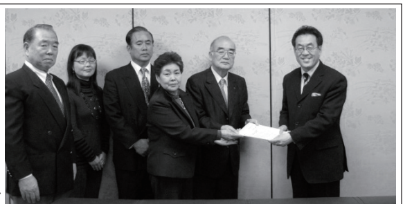
目黒区長へ提案の様子

平成 24 年 4 月 3 日（火）に西小山街づくり協議会委員 5 名の方により、西小山街づくり協議会で取りまとめた『西小山街づくり構想（案）』を目黒区（区長）へ提案しました。