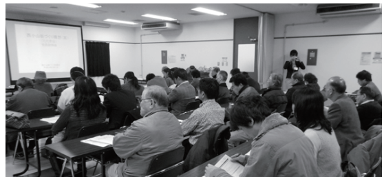
住民説明会 (3/3) の様子