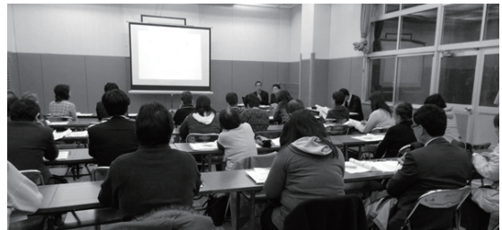
住民説明会 (3/1) の様子

住民説明会で頂いたご意見をふまえ、第 28 回西小山街づくり協議会で議論・検討し、「西小山街づくり構想（案）」として決定し、目黒区へ提案していきます。