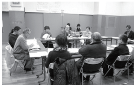
第 28 回協議会の様子

「西小山街づくり構想（案）」を提案した後の、平成 24 年度の街づくりの流れや進め方についても議論を行いました。