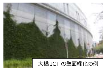
大橋 JCT の壁面緑化の例

※上記の写真は施工例です (実際に助成をした物件ではありません) みどりのまちなみ助成パンフレット