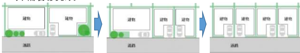
平均的な敷地の建物と緑化のイメージ

本地区は、比較的良好な住宅地ですが、相続等に合わせて敷地の分割が進み、みどりが減少しやすい傾向があります。