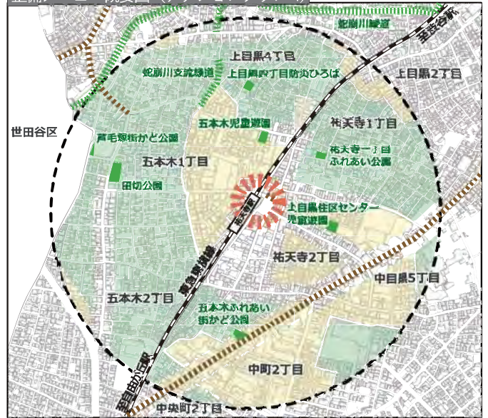
整備メニュー概要図（アクションプラン4）