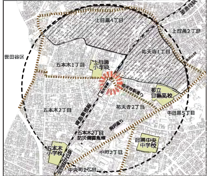
整備メニュー概要図（アクションプラン3）

※地域住民が生活の中で「ヒヤリ」としたり「ハッ」とするなど危険を感じたことについての対策（例）死角となる出入口の植栽などの改善やカーブミラーの設置など ■ : ハード事業 ○ : ソフト事業