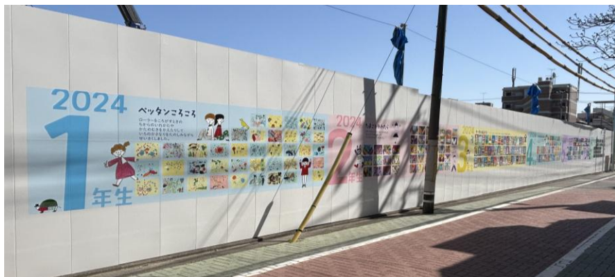
▲仮囲いアートの様子（西面）