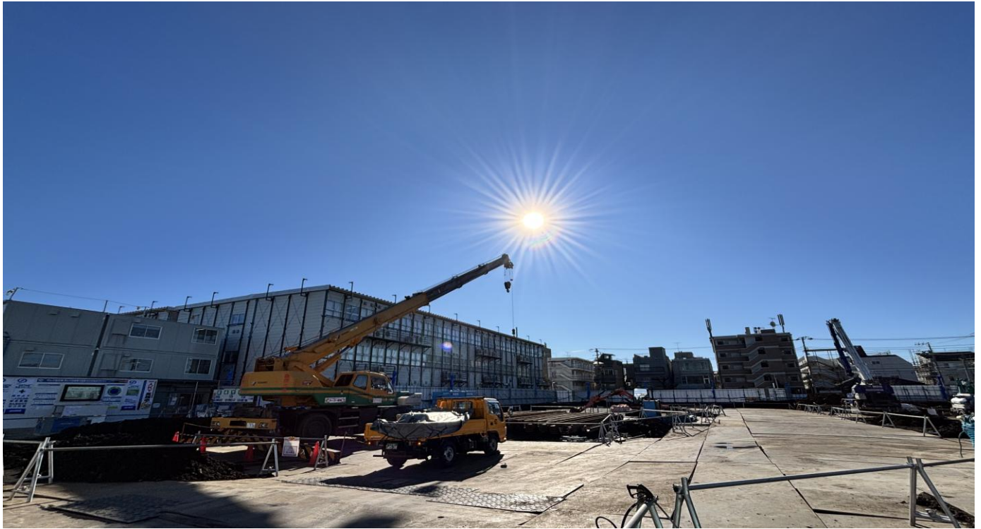
▲新校舎建設現場の全景（令和7年12月）

令和7年9月に向原小学校の新校舎建設工事に着手し、現在は基礎工事のための掘削を行っております。工事期間中は、周辺の皆様にご不便をお掛けいたしますが、周辺への影響をできる限り抑えながら作業を進めてまいりますので引き続きご理解とご協力をよろしくお願いいたします。