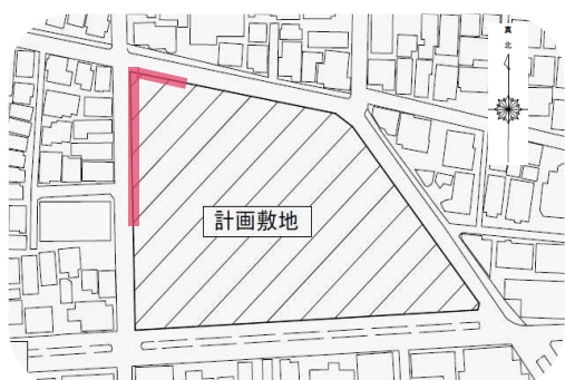
▲仮囲いアートの掲示位置図

向原小学校の2024年度の1～6年生と2025年度の1年生が描いた絵が、工事現場の仮囲いに掲示されました。子どもたちの自由な発想と元気いっぱいの絵が、工事現場を明るく楽しく彩っています。