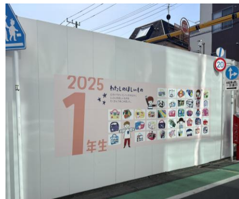
▲仮囲いアートの様子（北面）