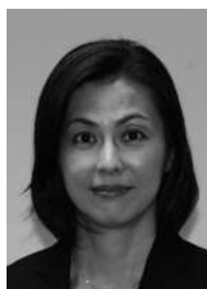
後藤教育長 職務代行者