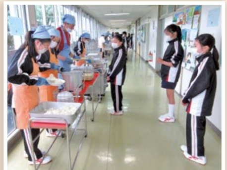
6月19日 給食再開 (第八中学校)