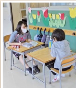
5月26日 連絡日 (烏森小学校)