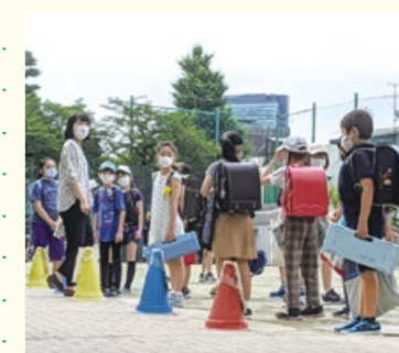
「新しい駒小生活」登校サポートの様子

子どもたちも感染症対策に気を配りながら、明るく楽しい学校生活を取り戻しています。