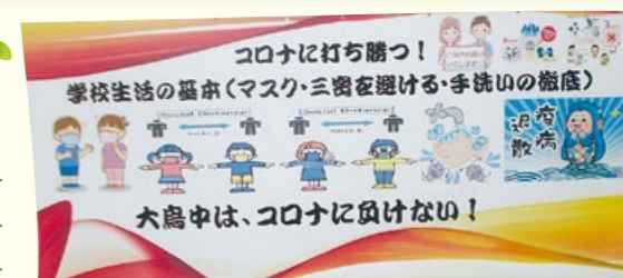
啓発ポスター(コロナに打ち勝つ！)

*禍福は糾える縄の如し…人生をより合わせた縄に例えて、幸福と不幸は変転するという意味の故事成語。