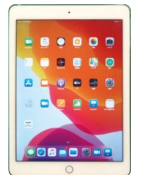
情報端末のイメージ