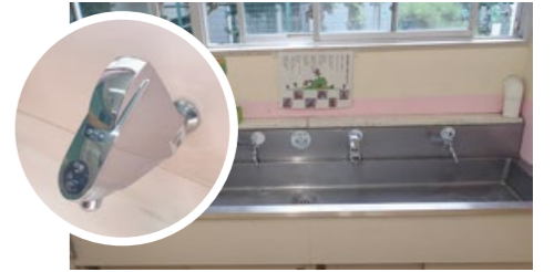
設置後の状況(中目黒小学校)

新型コロナウイルス感染症拡大防止対策として、児童・生徒等が水道蛇口に触れることなく手洗ができるよう、手洗い場の蛇口の一部を自動水栓化しました。また、蛇口ハンドルの一部をレバー式に切り替えました。