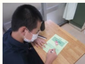
アンケート実施の様子(第一中学校)