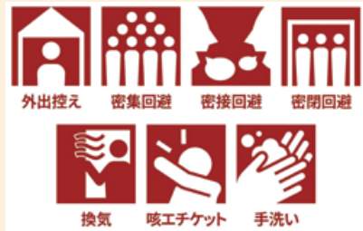
感染予防策のピクトグラム (厚生労働省ホームページより)

再開後も、感染症対策によりご不便をお掛けしていますが、引き続き、子どもたちの安全確保に全力で取り組んでいきますので、ご協力をよろしくお願いします。