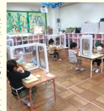
飛沫防止対策を講じた給食の様子

こまめな手洗いの励行やマスクの着用はもちろんのこと、降園後は教職員一丸となって園内の消毒をしています。