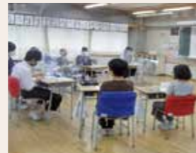
第十一中の会議で

また、第十一中学校区の地域全体でいじめ問題を考える意識が高まり、一層魅力的な地域になったと思います。