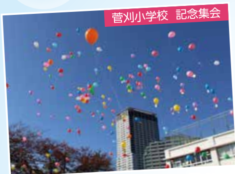
菅刈小学校 記念集会