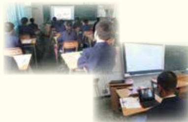
パラアスリートのオンライン講演を視聴する生徒(第八中)