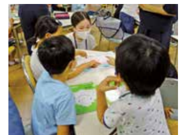
思考ツールを活用した授業

授業を分析し、よりよい授業づくりを目指しました。また、授業の終末に児童が記した振り返りカードに書かれた内容等を分析し、次の授業の展開を工夫するようにしたことで考える力が育ってきています。