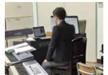
当日の授業者による発表はオンラインで