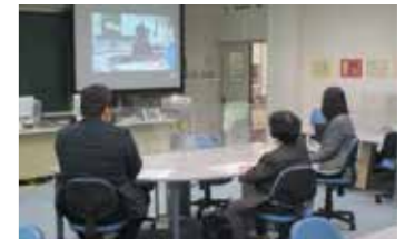
サテライト会場で当日の授業を公開