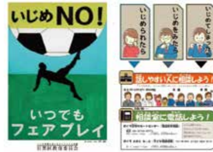
令和2年度いじめ防止啓発ポスター

教育委員会では、児童・生徒がいじめのない学校を目指す態度を育てることを目的として「いじめ問題を考えるめぐろ子ども会議」を中学校区ごとに実施しています。コロナ禍において、工夫しながら実施した2つの中学校区の取り組みを紹介します。