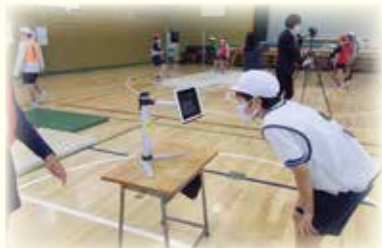
体育科において撮影した実技を振り返る児童(緑ヶ丘小)