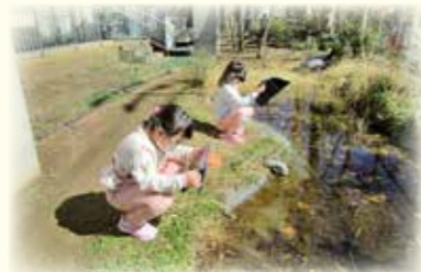
校外での自然観察で植物等を撮影する児童(碑小)