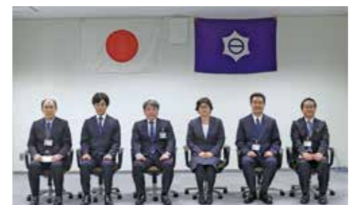
(撮影の時のみ、マスクを外しています。)

目黒区立学校授業スペシャリスト表彰制度は、優れた専門知識と指導技術をもつ授業力の高い教員を表彰するものです。令和2年度は2名が授業スペシャリストに認定されました。授業スペシャリストは、指導技術を若手教員等へ継承し、高い授業力をもつ教員の育成にも貢献しています。