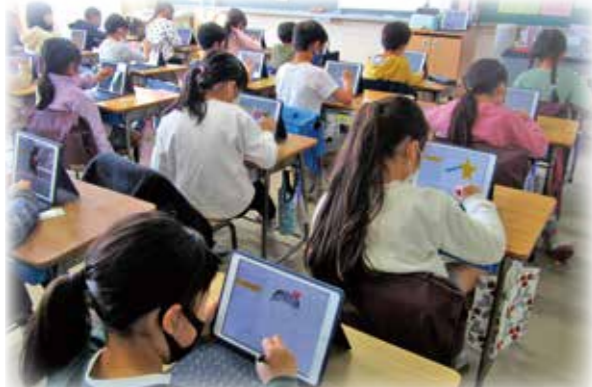
学習用情報端末iPadを手にした児童(向原小)