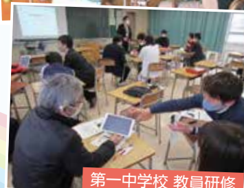
第一中学校 教員研修

子どもたちの安全・安心を第一に 「今できることを大切に」 教育活動に取り組んでいきます。 引き続き、感染症対策等に ご協力をお願いします。