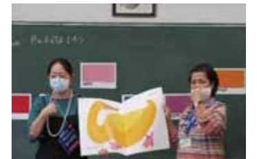
学級担任とALTによるトーク

中心となる活動で評価をし、その内容を分析し、次の授業の指導方法を考えていきます。