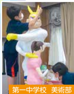
第一中学校 美術部