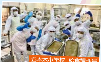
五本木小学校 給食調理員