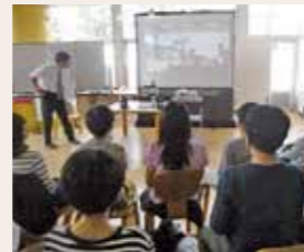
リモート参加する児童