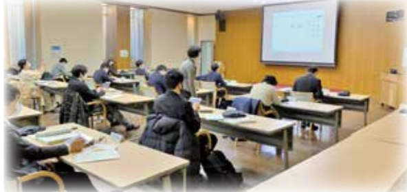
研修会に臨む教員(学習用情報端末iPad導入説明会)

令和3年2月から順次、区立小・中学校の児童・生徒に学習用情報端末「iPad」が一人に一台貸与され、目黒区のGIGAスクール構想元年が始まっています。