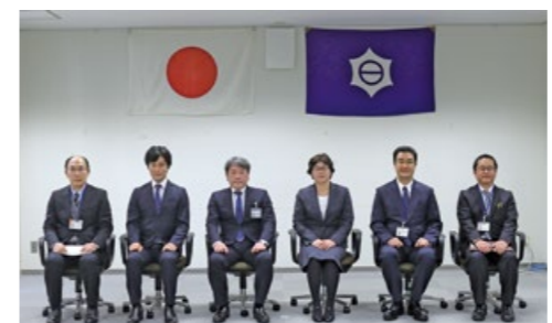
(撮影の時のみ、マスクを外しています。)

目黒区立学校授業スペシャリスト表彰制度は、優れた専門知識と指導技術をもつ授業力の高い教員を表彰するものです。令和2年度は2名が授業スペシャリストに認定されました。授業スペシャリストは、指導技術を若手教員等へ継承し、高い授業力をもつ教員の育成にも貢献しています。