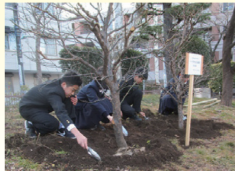
70周年記念植樹の様子

また、本校の生徒たちは、「さわやかな挨拶」や「ボランティア活動」への積極的な参加など、日々、社会性を身に付けていますが、これらの活動は、保護者や地域の皆様のご協力に支えられています。第七中学校は、学校、家庭、地域が一体となって生徒たちを育てるという体制が、しっかりと根付いている学校です。