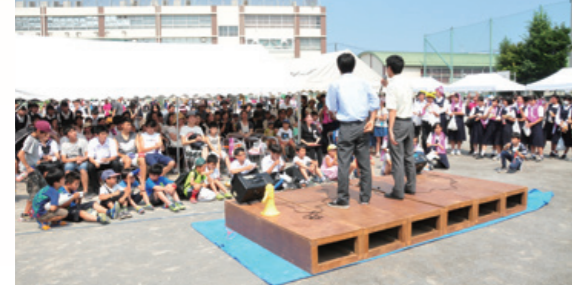
七中まつりの様子

平成28・29年度東京都教育委員会人権尊重教育推進校、同特別支援教室モデル事業指定校としての先進的な教育を推進し、「他者理解の態度」の育成に努めてきましたが、その成果を活かすのは言うまでもなく、学校の基本は授業という意思のもと、「より分かりやすい授業」を目指し、基礎・基本の定着・学力向上に努めています。