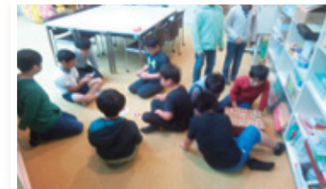
●ぼかぼかスペース

本年度、開校60周年を迎えました。これからも、保護者や地域の方とともに「明るい学校 楽しい学校 笑顔あふれる学校」「子どもたちが生き生きと過ごせる学校」を目指し、「心ゆたかで明るい子」を育てていきます。