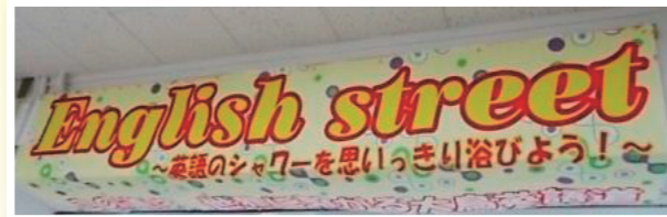
●校内にある「イングリッシュストリート」

2年生対象の「イングリッシュキャンプ」も、開校前年に旧第三・第四中学校の生徒を対象として行った交流事業も含め今年で5回目となりました。毎年、工夫や改善を重ね、素晴らしい行事として定着しつつあります。参加生徒を支えてくださった保護者の皆様、熱心なALTの先生、サポートして下さったスタッフの皆さんのご協力の賜物です。