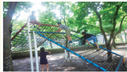
●休み時間の「みの森」