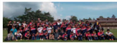
●2年イングリッシュキャンプ