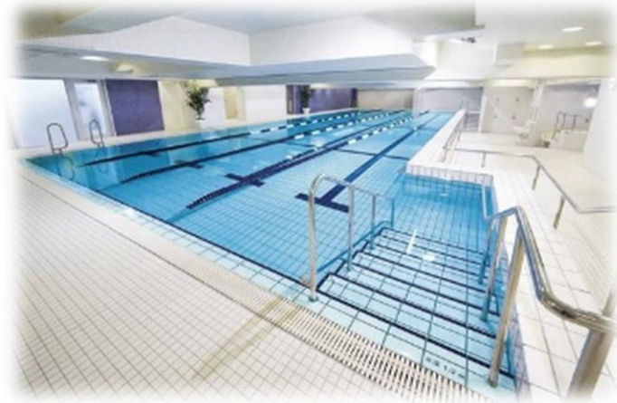
向原小学校 (コナミスポーツクラブ碑文谷)