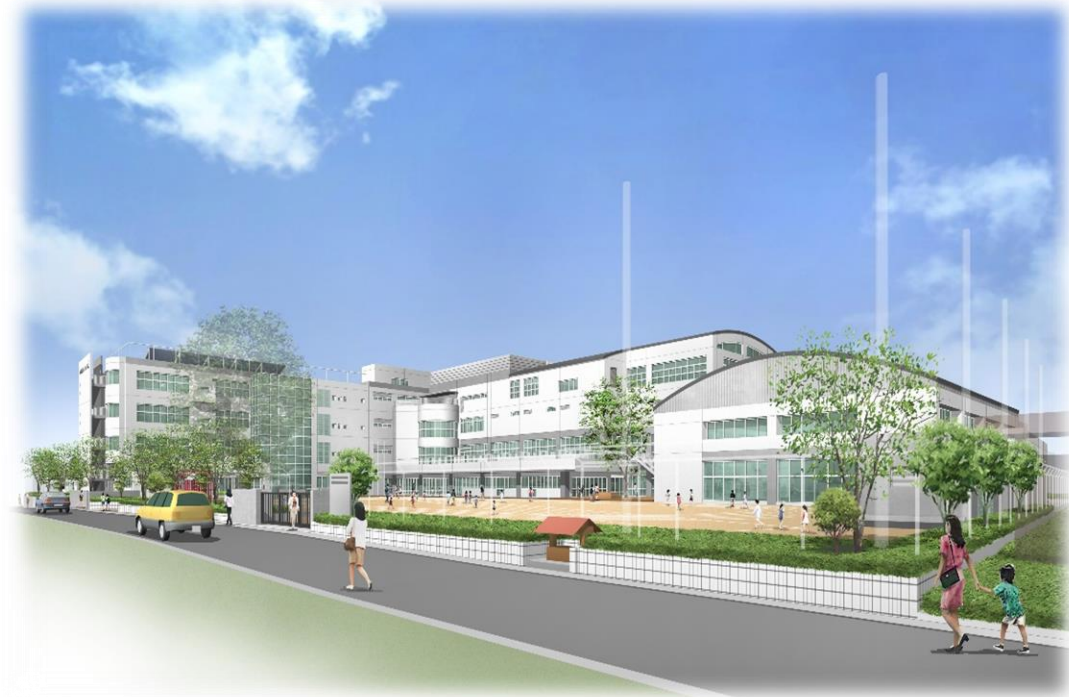
碑小学校のイメージ図（平成19年竣工）