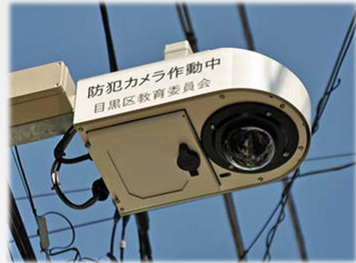
通学路防犯カメラ