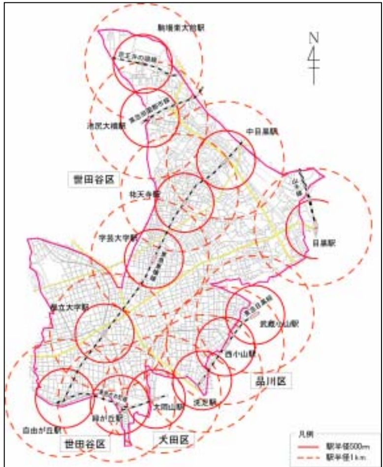
目黒区の駅の分布と徒歩圏の状況

目黒区を徒歩圏(おおむね半径500m~1km)とする駅は、東急東横線、東急大井町線、東急目黒線、東急田園都市線、JR山手線、京王井の頭線の6路線13駅です。