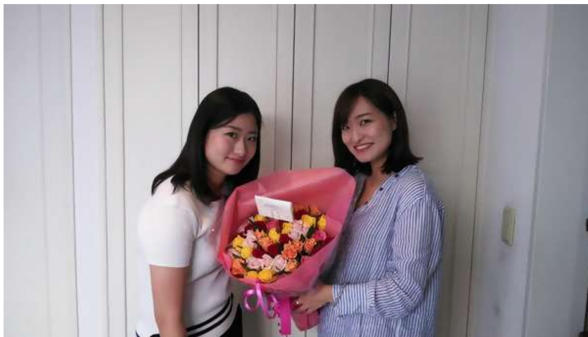
toBe 塾卒業生の弁護士と医師