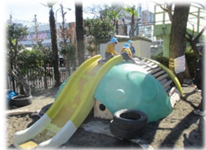
砂場の隣には子ども達が大好きな「ぞうさんすべりだい」があります