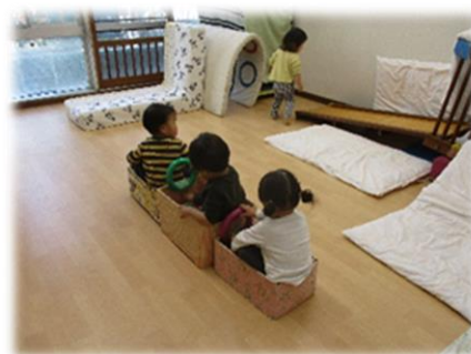
手作りの電車に乗りごっこ遊び