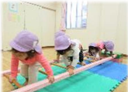
巧技台を設定してはしご渡りを楽しんでいます