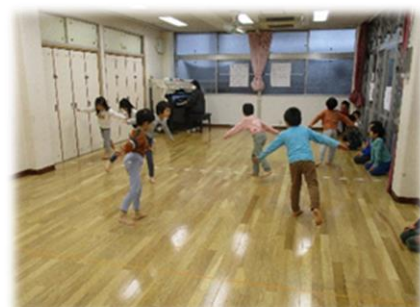
ピアノに合わせて走る、跳ぶ、這うなど様々な動きをするリズム遊びを行っています