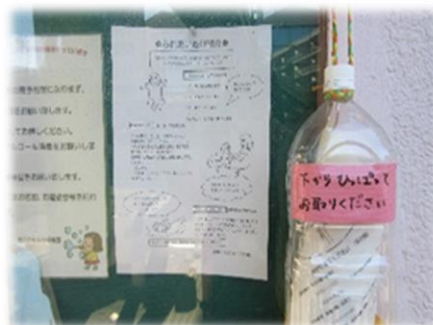
外の掲示板には行事や情報を設置しています