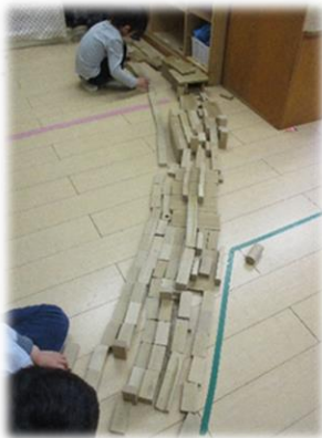
積み木を構成しながら友だちとイメージを共有して遊びを広げています