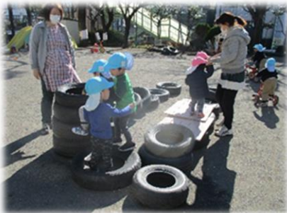
タイヤを高く積み上げて登って遊ぶ