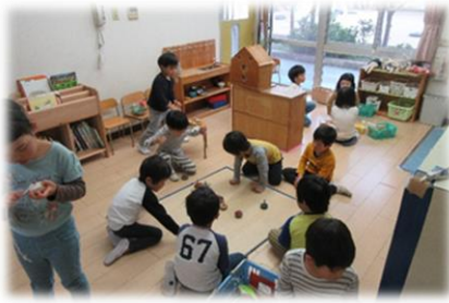
友だちと一緒にコマ遊びを楽しんでいます