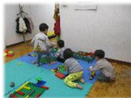
車や電車を走らせ、ブロックをつなげて遊ぶ