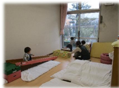
トンネルくぐりや斜面台の登り降り