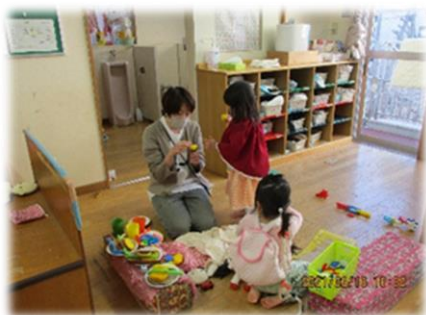
保育士と一緒にままごと遊び