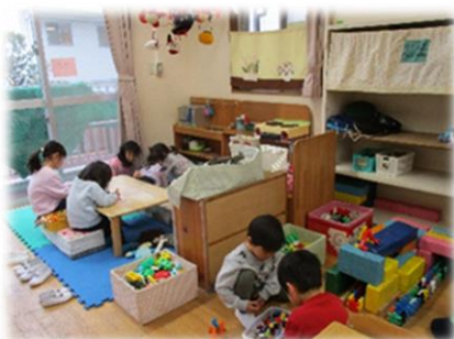
子ども達が絵を描いたり好きな遊びをしています