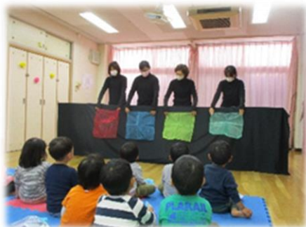
乳児お楽しみ会などの行事では地域の利用者も楽しめます