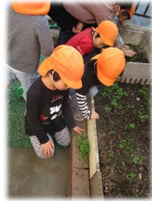
水やりをしながらにんじんの生長の様子を観察しています