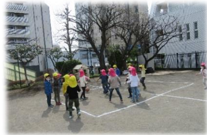
自分たちでチーム分けをし、ルールを決めてドッジボールを楽しんでいます