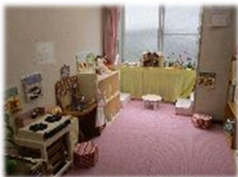
ことりのへや 地域の利用者が遊べるスペースです