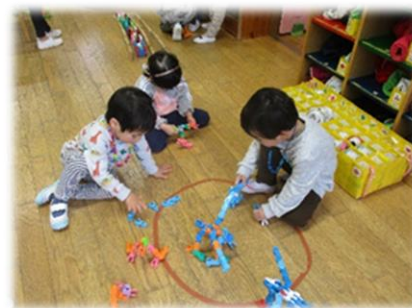
イメージをいろいろな玩具を使って形にして作ったもので遊ぶ