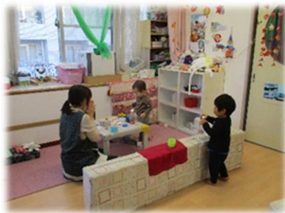
保育士と一緒に遊ぶ