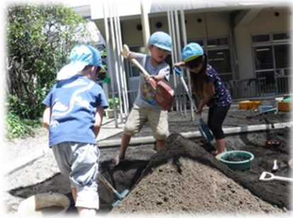
友達と力を合わせて砂山作り