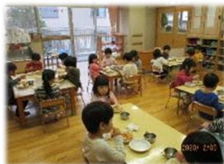
畑で育てた野菜を食べる