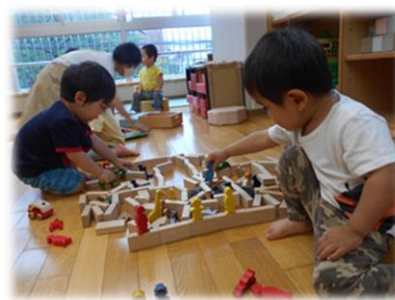
友達と積み木遊び