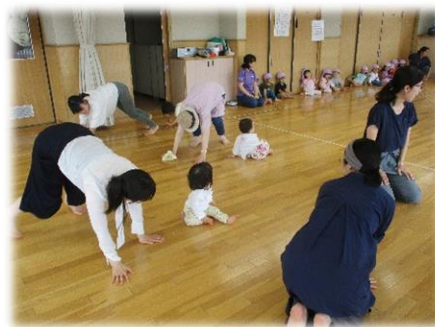
園児と地域の利用者が一緒にホールでリズム遊び