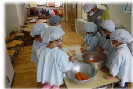
5歳児はピーラーを使って人参の皮むき