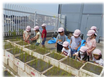
苗を植え、水やり、藻を取り、稲の生長を楽しみにしています