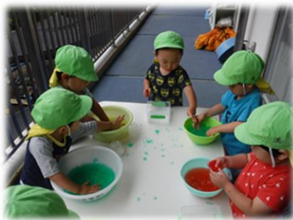
寒天を使って感触遊び