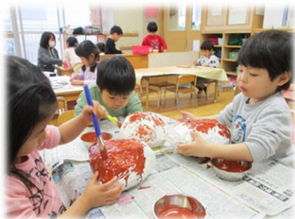
劇遊びに使うどんぐり作り