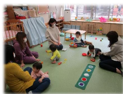
利用者同士で情報交換やひろばの相談員が育児について相談を受けています