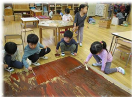
劇遊びで使う背景の色塗り