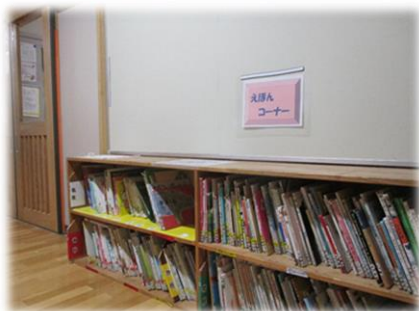
絵本の貸し出しコーナー