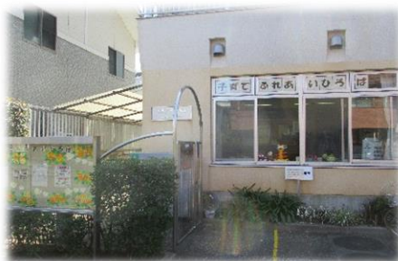
園舎の隣に子育てふれあいひろばの入口があります 保育室には大きな窓があるので日当たりも良く、桜並木の緑道沿いなので春は保育室からきれいな桜が見えます