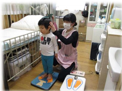
月に一度の身体計測