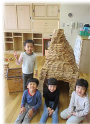
5歳児が作った積み木に憧れて友達や保育士と一緒に積み上げて大作に挑戦