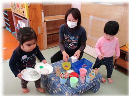
保育士と一緒に遊ぶ