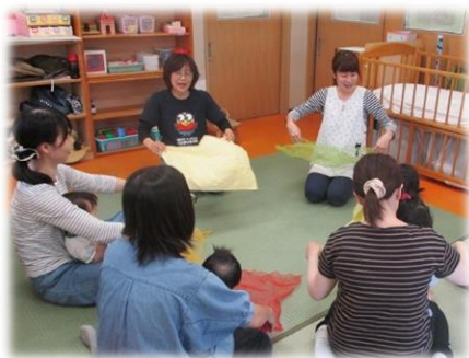
地域の利用者と一緒にふれあい遊びや手遊び