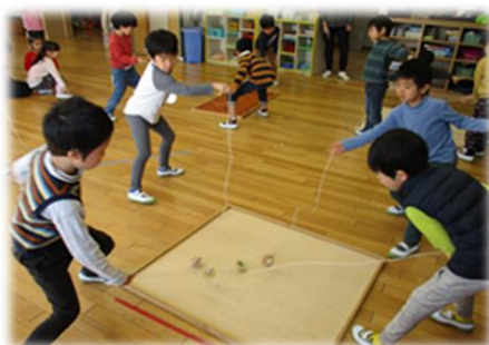
友達と楽しくコマ回し