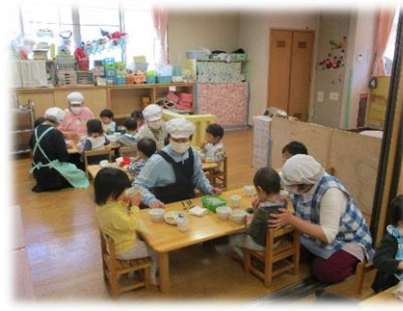
友達と一緒に食事をしている様子