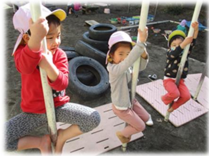
腕の力と足裏を使って登り棒に挑戦