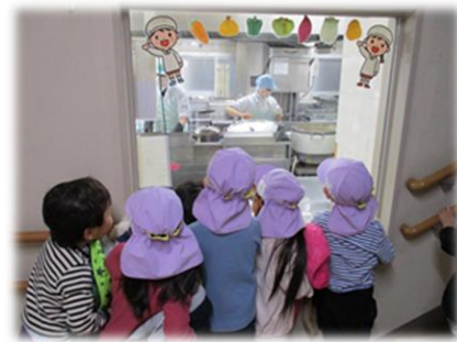
階段踊り場から調理室の中が見え 子どもたちは楽しみにしています