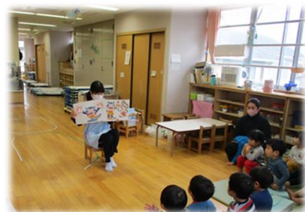
健康教育は子どもたちの発達や興味に 合わせて行います