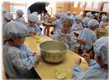
給食に食べる白菜ちぎり