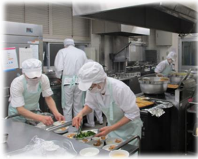
旬の食材を使った給食作りの様子