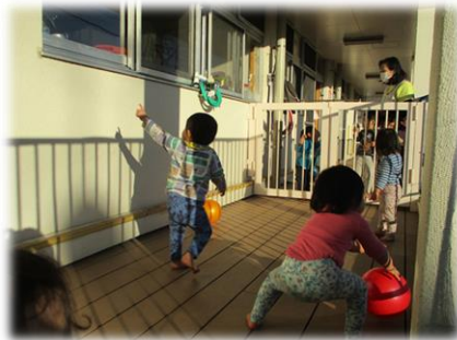
テラスでボール遊び