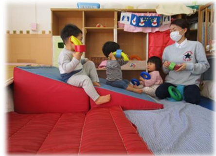
「もしもし」と電話をかける真似