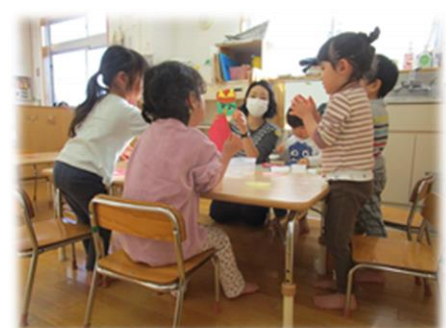
机上で制作やパズル、紐通しなどで 手先を使って遊ぶ