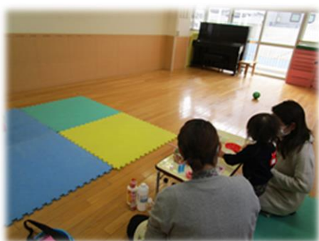
利用者と水時計作り