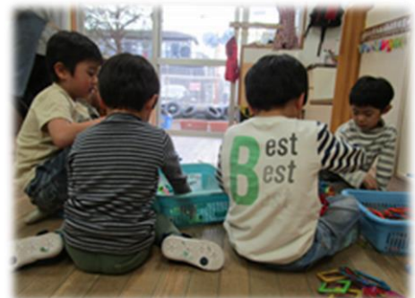
友達とクリップやマグネットで作って 遊ぶ