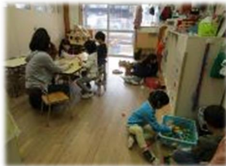
積み木や人形のお家などで 友達とイメージを共有しながら遊ぶ