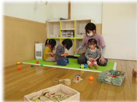
保育士や友達と一緒にブロック遊び