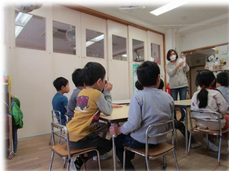
みんなで一日の流れや今週の予定などを 確認