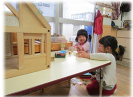
友達とおうちごっこ