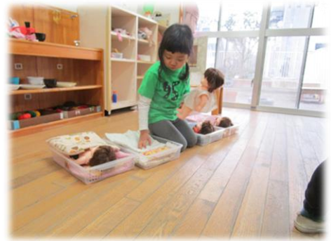
赤ちゃんの世話遊び