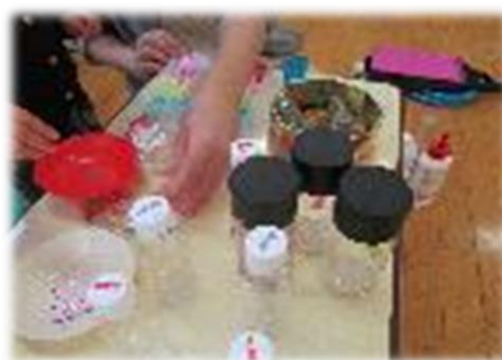
手作りおもちゃを作ろう