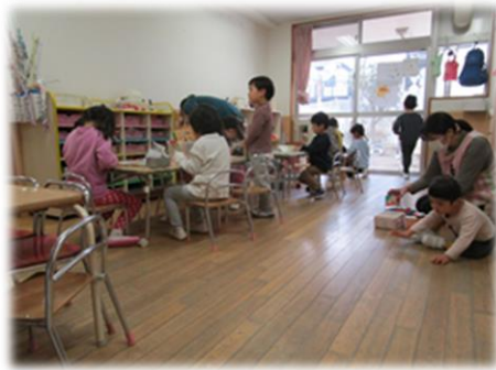
折り紙やお絵かき遊び