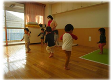
音や歌に合わせて思い切り身体を動かす