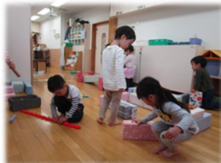
牛乳パックで作った積み木を使って ごっこ遊び