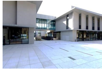
中目黒に開校した東京音楽大学