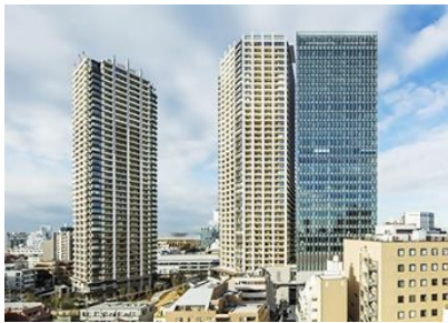
市街地再開発事業により 誕生した目黒駅前の高層ビル