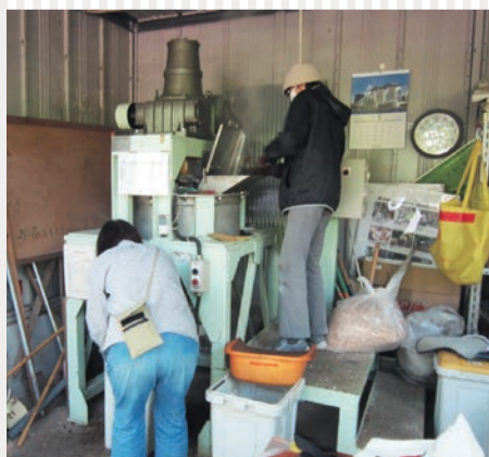
堆肥化の活動風景