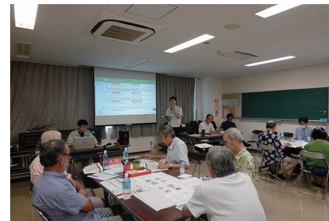
区の将来像、現地や周辺の説明

令和6年8月4日（日）に、原町住区センターで「原町二丁目新設公園」について、第1回検討会を行いました。20人の地域の皆さんにお集まりいただき、地域の将来像や現地状況の説明を行った後、A～Dの4班に分かれてどのような公園にしていくか検討を行いました。バス通りに面していることから安全な歩行空間の確保、防災や遊びの機能の確保、日陰の確保など、活発にご意見を出して頂きました。