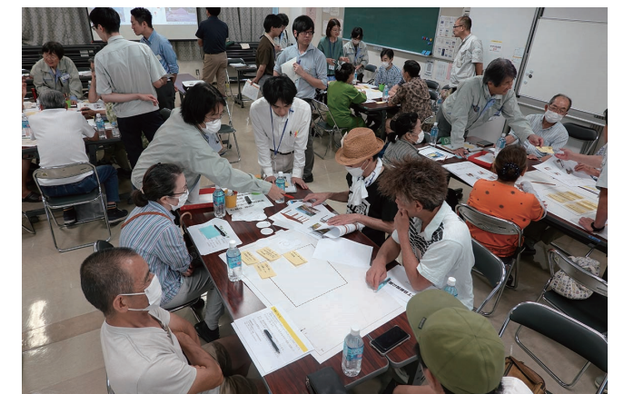
4班に分かれての検討