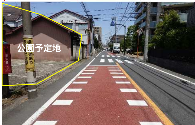
所在地：目黒区原町二丁目3番1号、17号