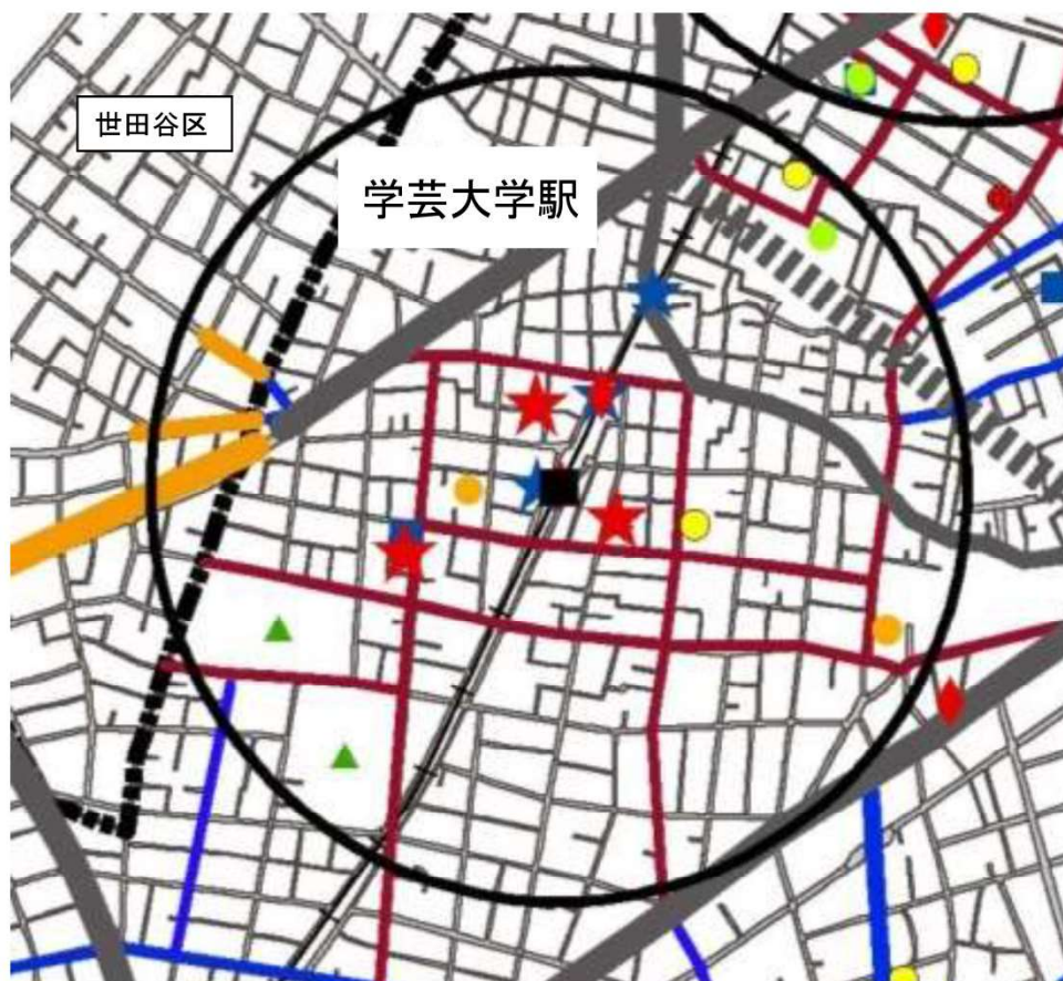
この地図は、東京都知事の承認を受けて、東京都縮尺2,500分の1地形図を利用して作成したものである。(承認番号)29都市基交著第30号