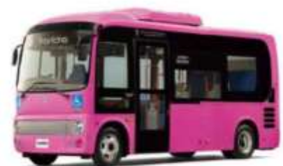
運行車両のイメージ