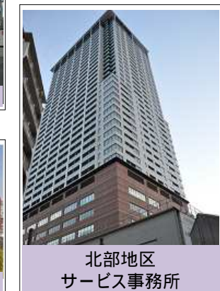
北部地区 サービス事務所