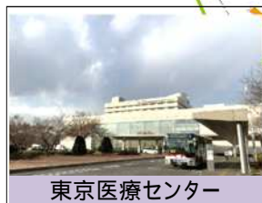
東京医療センター