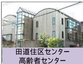
田道住区センター 高齢者センター