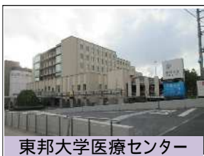
東邦大学医療センター