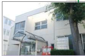
大岡山西住区センター