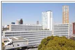
目黒区役所(総合庁舎)