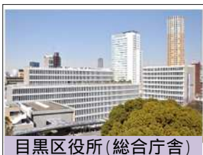
目黒区役所(総合庁舎)