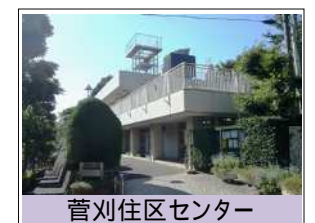
菅刈住区センター

東京都区部が含まれる京浜ブロック平均値 (国土交通省HP「令和元年度乗合バス事業の収支状況について」) 運行経費は人件費、燃料費、車両修繕費などの費用で、車両代金や 停留所整備費用は含まれない