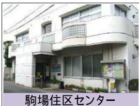
駒場住区センター