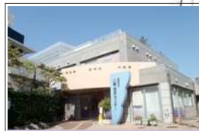
八雲住区センター