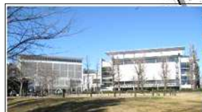
めぐる区民キャンパス (めぐるパーシモンホール)