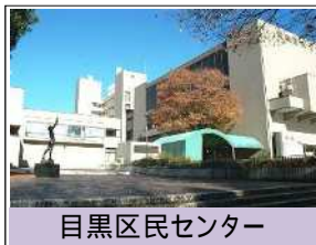
目黒区民センター