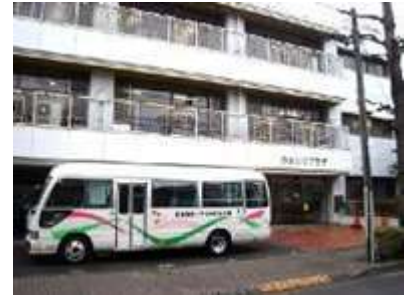
目黒区児童発達支援センター