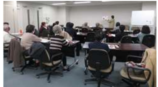
令和3年度に実施した「りぷりんと」

※令和3年度から事業開始（令和2年度から事業開始予定であったが、新型コロナウイルス感染拡大防止のため令和2年度の開催は見送った）