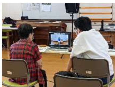
【オンラインによるフレイル予防の様子】

オンラインを利用した介護予防教室を実施。オンラインに不慣れな方、初めての方でも参加しやすいよう、事前にオンライン操作説明会を実施している。