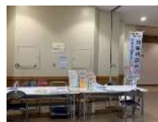
商業施設での出張相談会