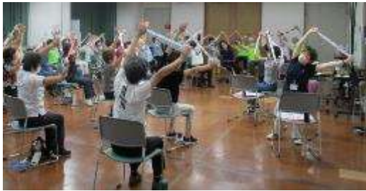
【事業終了後、活動を継続するグループの様子】

介護予防の知識を学び、事業終了後は参加者がめぐろ手ぬぐい体操やウォーキング活動を行うグループとなり、介護予防・フレイル予防を続けることをめざす。