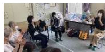
出張相談・ミニ講座・居場所づくり