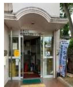
住区センターでの出張相談会