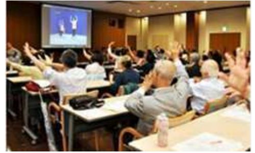
令和元年度に実施した地域デビュー講演会