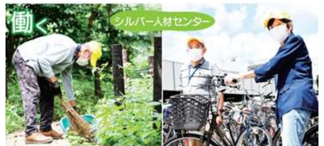
シルバー人材センター会員の就業風景