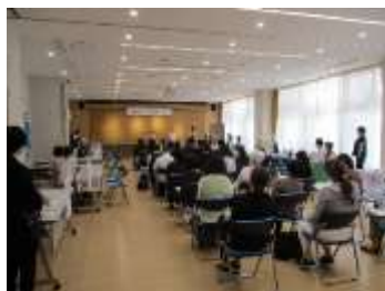
めぐろ福祉しごと相談会の様子