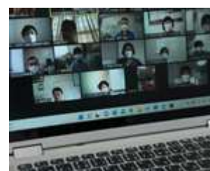
コロナ禍オンラインを使用した 関係機関との連携

令和2年度から3年度にかけては、新型コロナウイルス感染症の影響により、出張相談及び地域ケア会議の開催回数が減、また各種講座やイベントが中止となった。