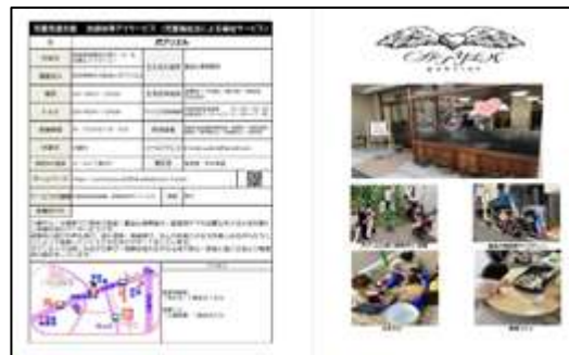
めぐろの発達支援事業所等リストブック