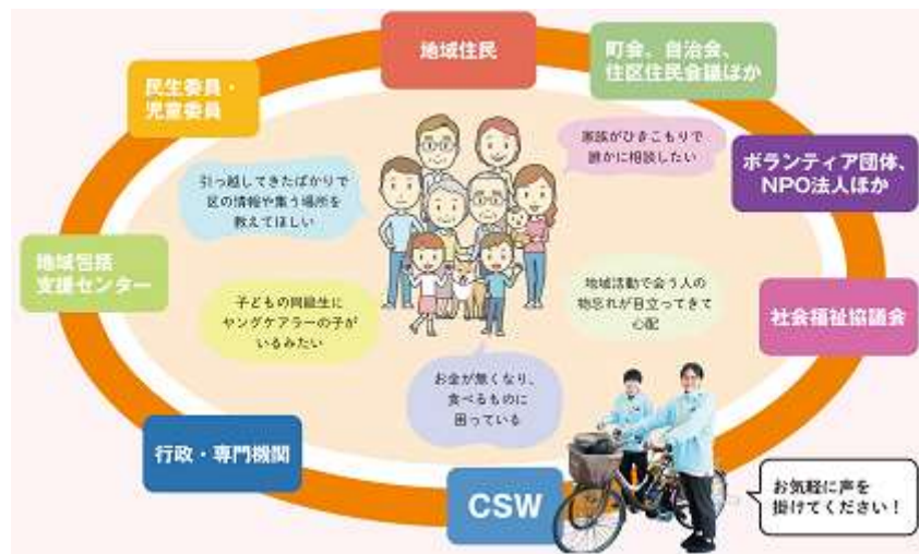
CSWの活動イメージ図