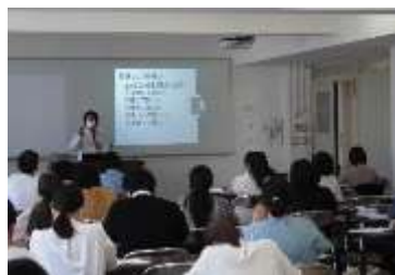
特別支援教育研修