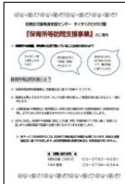
保育所等訪問支援チラシ