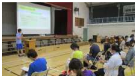
若手教員向け「初任者研修」 の障害に関する講座