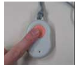
非常通報システム ペンダント型通報機