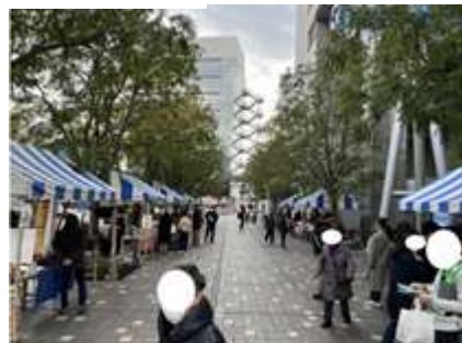
区内障害福祉施設及び障害者団体の自主生産品の販売