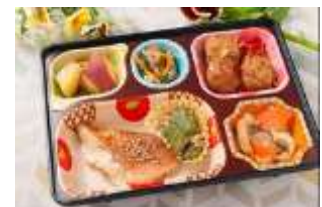
配食サービス・配食例