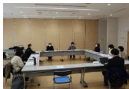
基幹相談支援センター事例検討会の様子