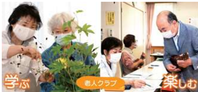
老人クラブの活動風景(令和3年9月15日号区報から)