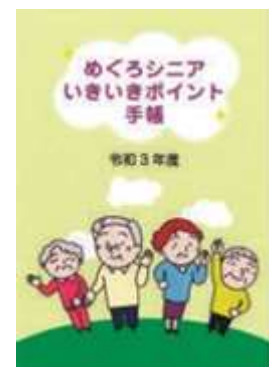
めぐろシニアいきいきポイント手帳