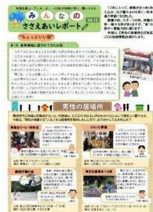
ささえあいレポート発行