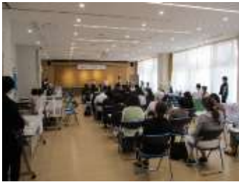
めぐろ福祉しごと相談会の様子