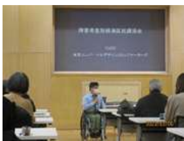
差別解消区民講演会