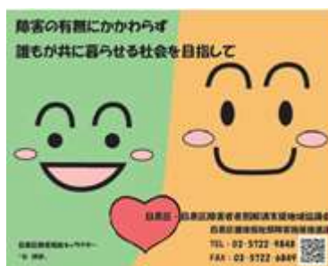
啓発グッズ（カイロ、ポケットティッシュ）