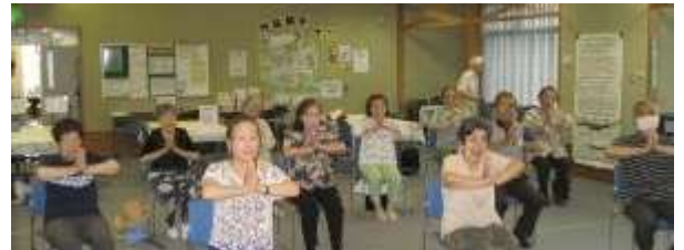
地域交流サロンで実施した体操教室

※2：新型コロナウイルス感染拡大防止のため、令和2年度は10～11月のみ実施、令和3年度は4月のみ実施、令和4年度は中止した。