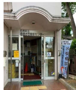
住区センターでの出張相談会