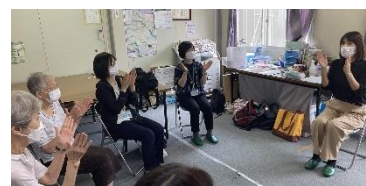
出張相談・ミニ講座・居場所づくり