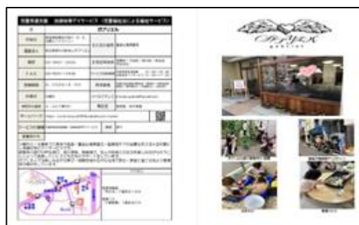
めぐろの発達支援事業所等リストブック