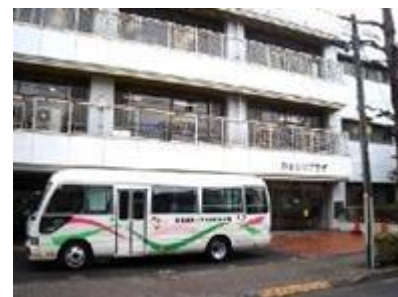
目黒区児童発達支援センター