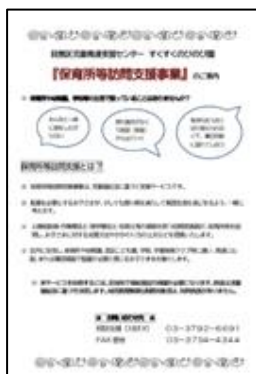
保育所等訪問支援チラシ