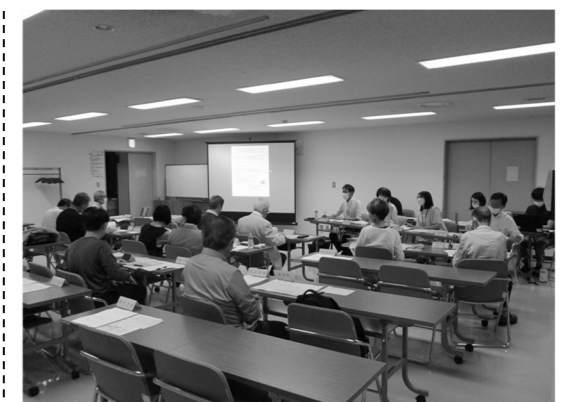
写真：第1回 区民センター周辺地区まちづくり協議会の様子