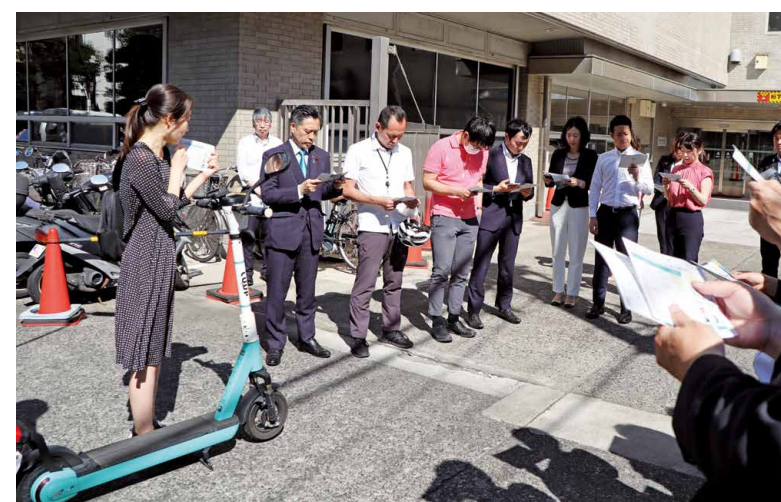
▲講師から交通ルールの説明を聞く議員(総合庁舎本館駐輪場)

第2回区議会定例会では、電動キックボードに関連する条例改正案が審議されました。それに先立ち6月16日に、7月以降の道路交通法改正による交通ルールと安全な利用方法を学ぶ、電動キックボードの議員勉強会を開催しました。