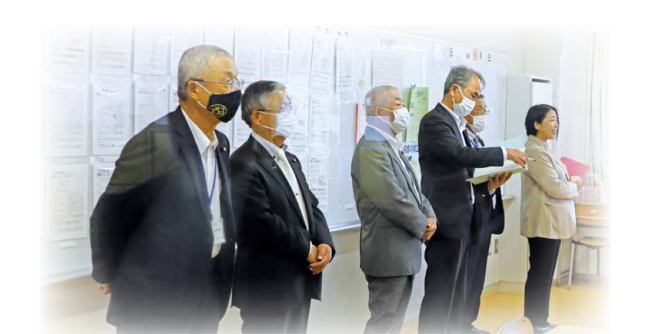
▲授業を見学する角田市議会議員(目黒中央中学校)