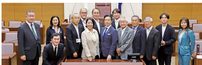
▲角田市議会議員と目黒区議会議長、副議長、各会派幹事長(議場)

5月29日に友好都市である角田市議会の教育厚生建設常任委員会が、ICT教育の取り組みについて視察を行いました。