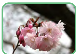
ジュウガツザクラ