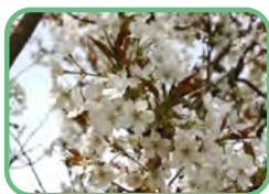
スルガダイニオイ