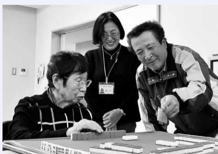
▲地域主催の健康麻雀教室で活動する様子