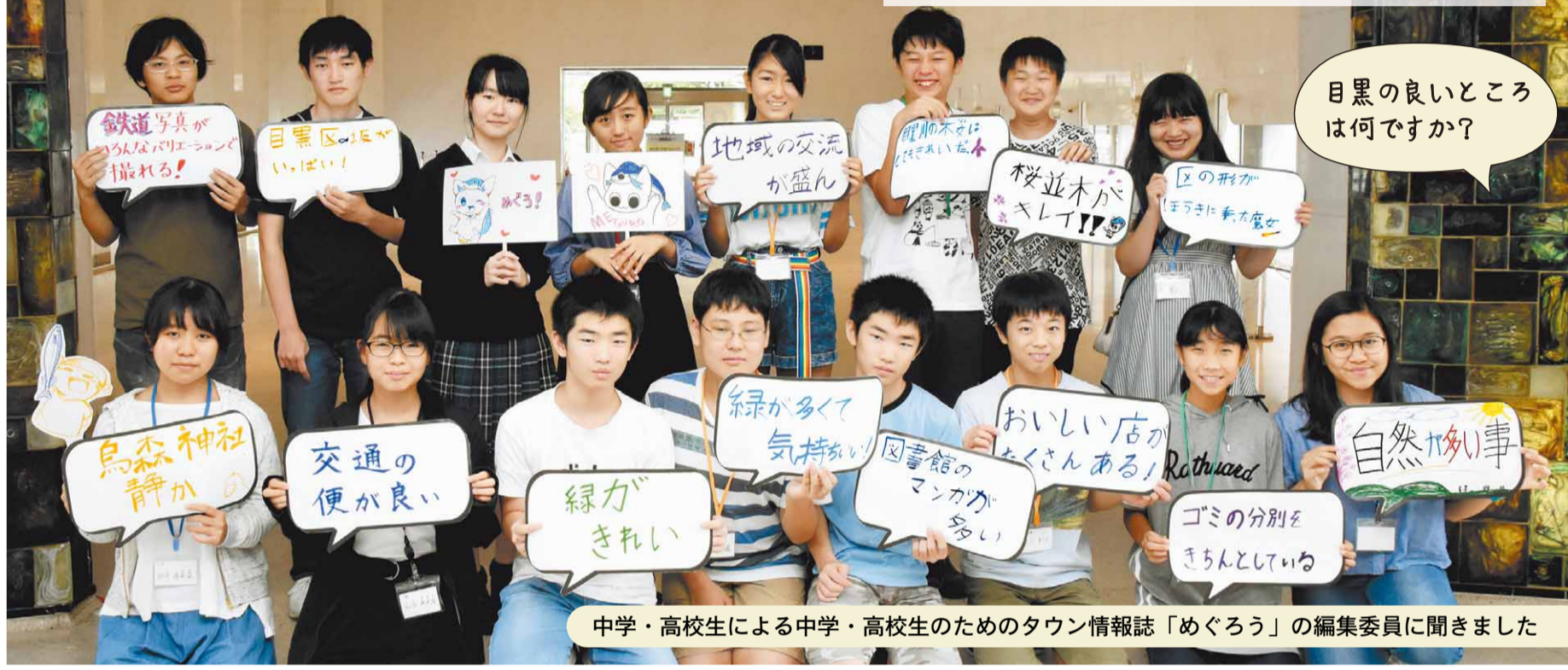
中学・高校生による中学・高校生のためのタウン情報誌「めぐろ」の編集委員に聞きました

基本構想は、区の望ましい将来像と、それを実現するまちづくりの基本目標や施策の基本的方向を示したものです。現行の基本構想策定から18年が経ち、区民生活や区政を取り巻く環境は大きく変化しました。21世紀半ばに向けた長期計画とするため、基本構想を見直します。 今後、区民の皆さんのご意見をお聴きするとともに、検討状況をお知らせしていきます。 図長期計画コミュニティ課 (☎5722-9372、☎5722-6134)