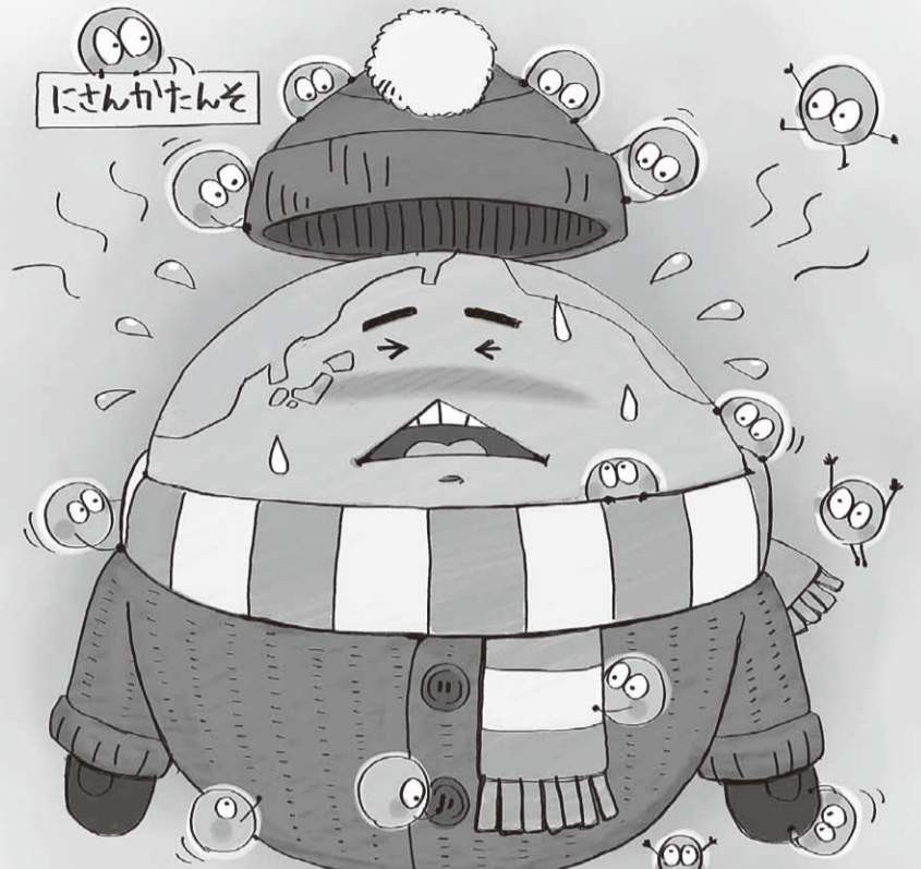
▲地球温暖化対策の啓発絵本「しろくまフロートくんのおねがい」より

化石燃料の大量消費によって放出される二酸化炭素が増加したことで、気温や海水温が上昇しています。これが、地球温暖化です。近年の異常高温(熱波)や大雨・干ばつの増加などは、地球温暖化によるものだと考えられており、その影響は、水資源や農作物等、自然生態系や人間社会にすでに現れています。このままでは将来、地球の温度はさらに上昇すると予想され、熱中症患者や大型台風の増加、農作物の不作など、深刻な影響が生じると考えられています。