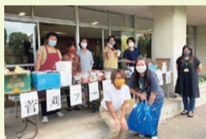
▲菅刈住区住民会議が実施した フードドライブ

食べられるのに捨てられている食品の量は、日本で年間約570万トン。フードドライブは、家庭で余っている食品を集めて福祉団体や施設などに提供する活動です。地域、学校や職場で食品ロスを削減する取り組みとして、フードドライブを実施してみませんか。