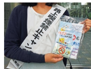
▲令和元年度の啓発活動