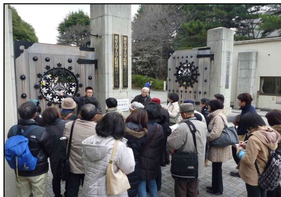
建築めぐり塾「東大駒場キャンパス編」

担当所管 教育委員会事務局 企画調整課 計画調整係 直通電話 03-5722-9682 内線番号 (3516)