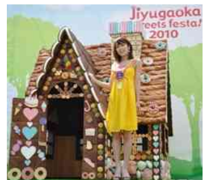
自由が丘スイーツフェスタ 2010

区内の観光資源を発掘し、目黒の魅力を広くアピールするためのPR活動（ホームページ、街あるきガイド発行等）について支援します。