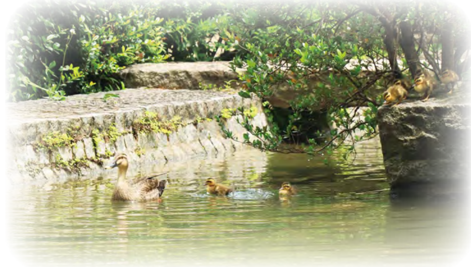
▲カルガモの親子(総合庁舎の中庭の池で5月31日撮影)